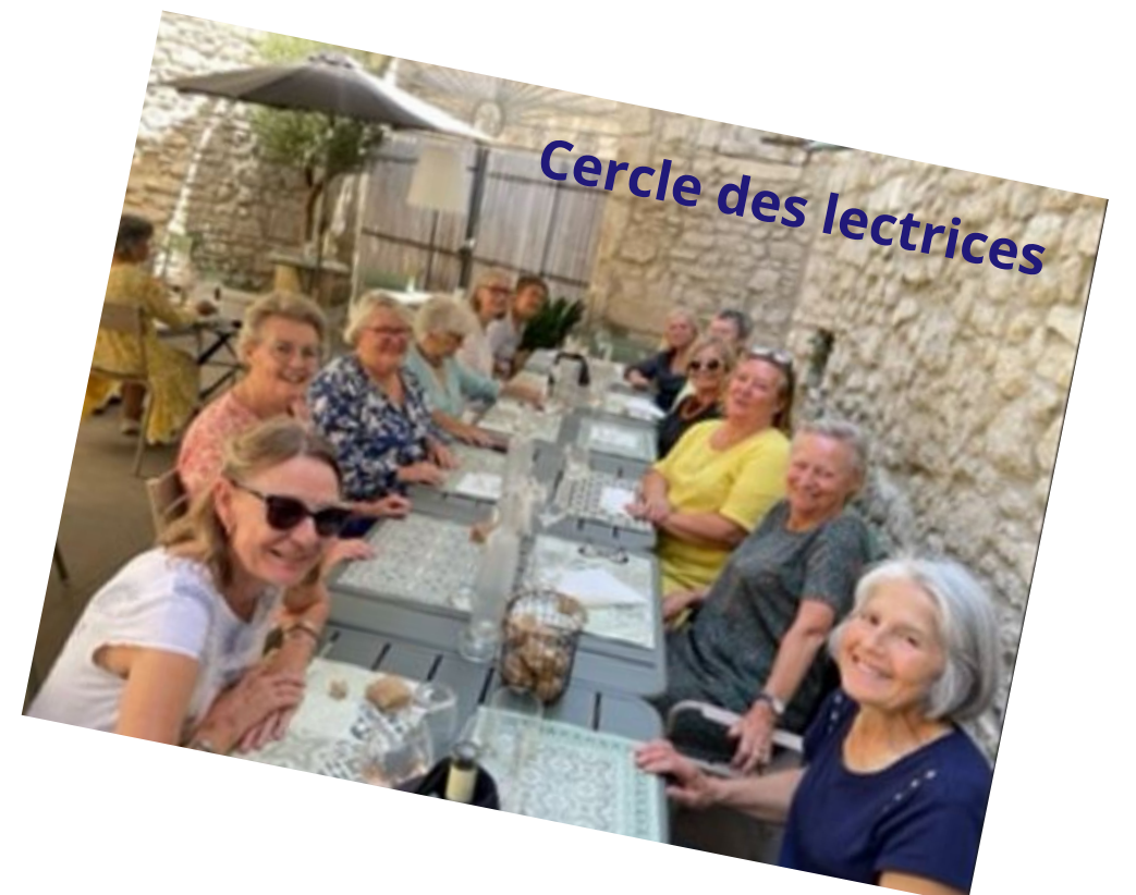
Cercle des lectrices