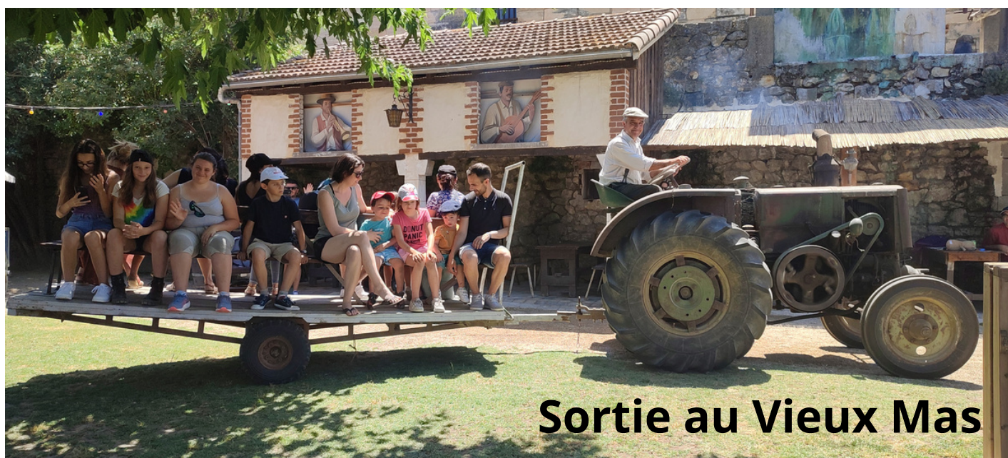
Sortie au Vieux Mas