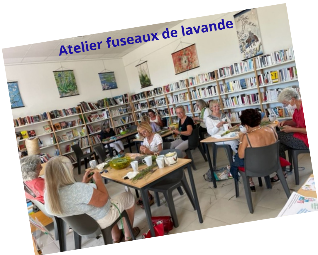
Atelier fuseaux de lavande