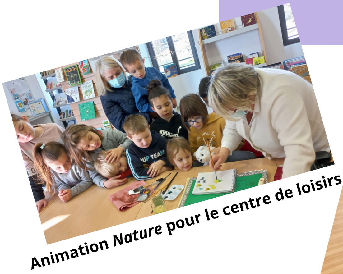
Animation Nature pour le centre de loisirs