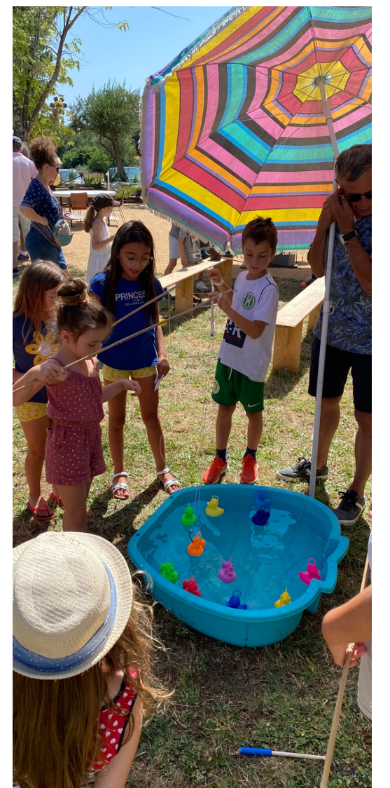
Fête de l'Aphyllanthe