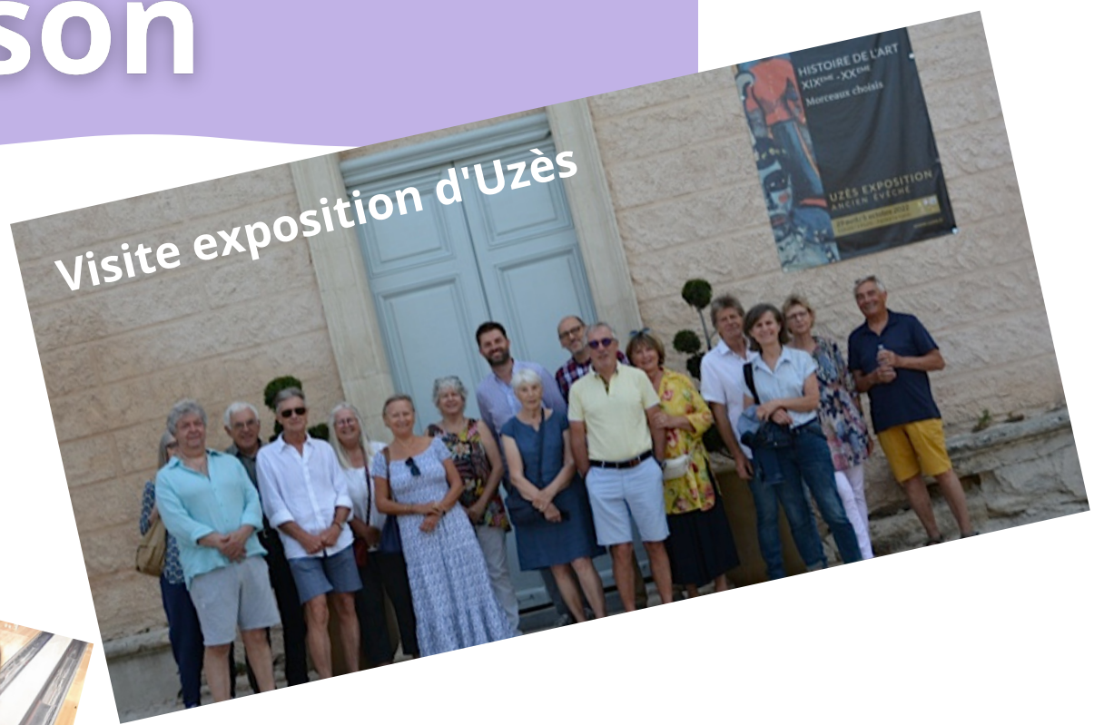
Visite exposition d'Uzès